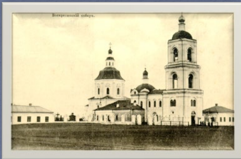
Красноярск. Воскресенский собор