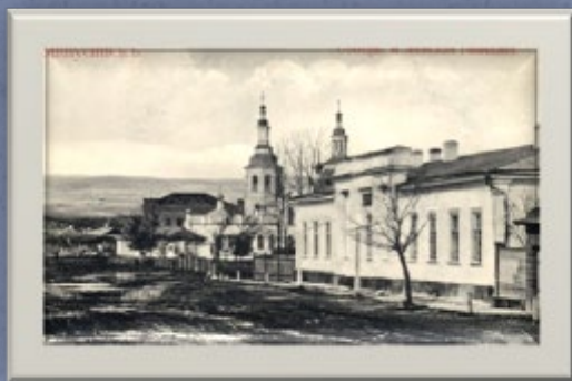
Минусинск. Собор и женская гимназия