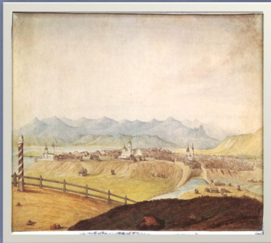
Вид на г. Красноярск